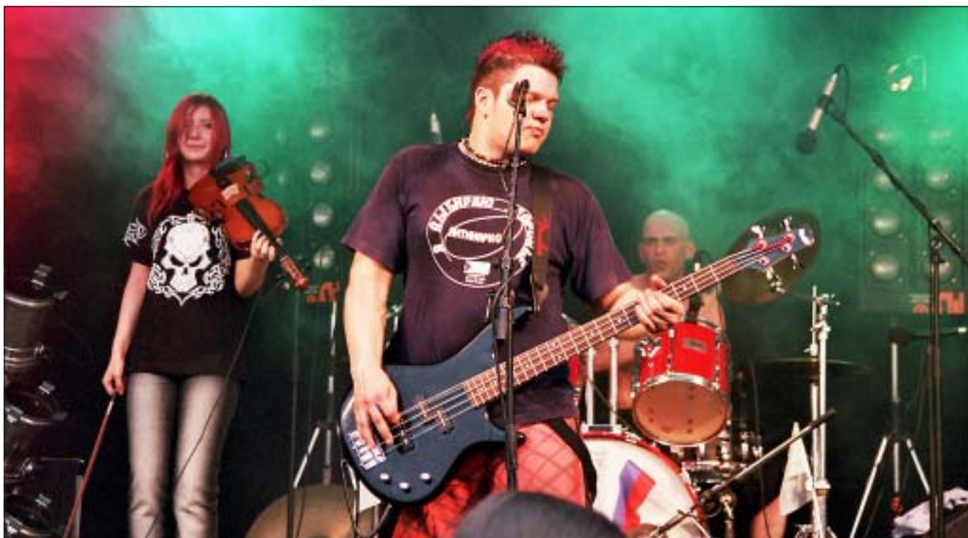
RYSKA ROCKARE Aspirin från Ryssland bjöd publiken på tungt rockigt ös från öst.