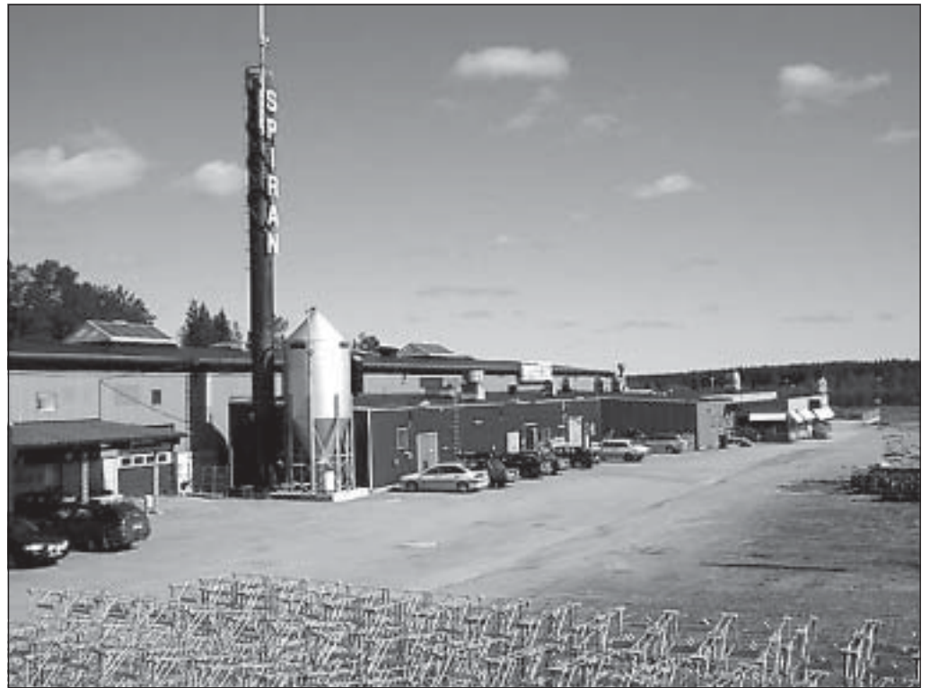
Ett 60-tal människor bärgar sitt dagliga bröd i industrihuset nere vid E4:an i Sikeå.

Men även om vissa företag har försvunnit och andra har krympt, så är det stor aktivitet. Kvar finns Cue Dee, Recticel, Tryckeriet, Glasbyggarna