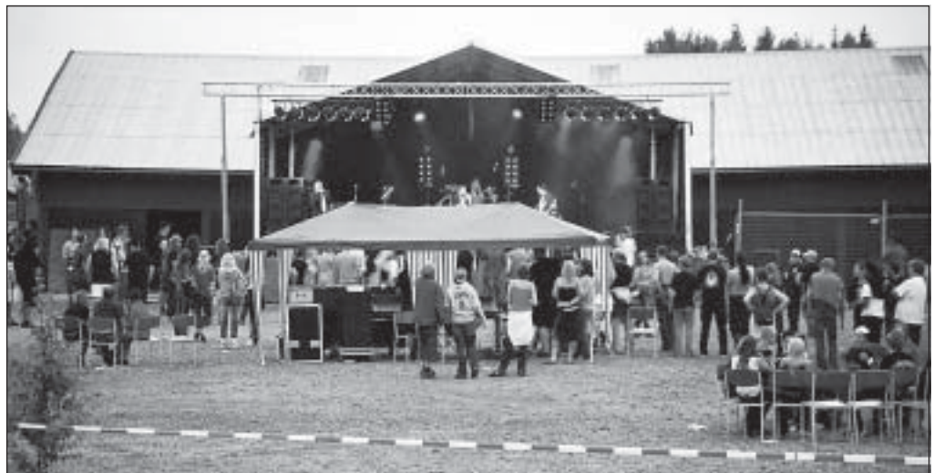
Rockfestival på hamnområdet ställer sig båtklubben mycket tveksam till.

Själv höll jag på att få dåndimpen, krupp och hjärtstillestånd när jag upptäcker ett gäng som tagit båtmagasinet till sin boning och där en del på det snustorra golvet njöto tobakens varma rök, är det