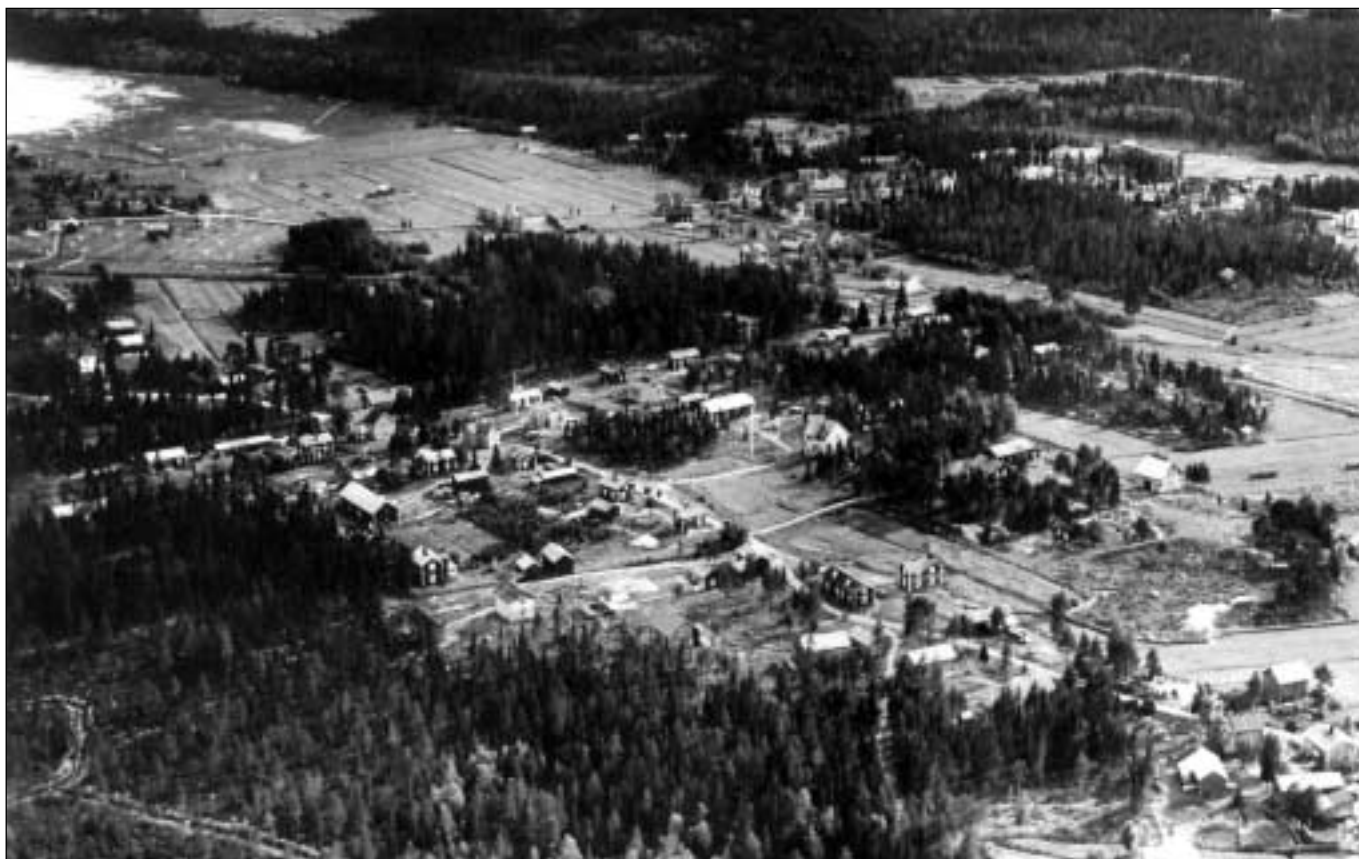
FOTO FRÅN FÖRR På bilden kan man se hur det såg ut i Brännstan och på skolbacken i mitten av 1930-talet. Uppe till vänster på bilden syns också en del av "Plassen". Lagg märke till de öppna markerna på Storholmen och annorstädes. Något att återskapa!