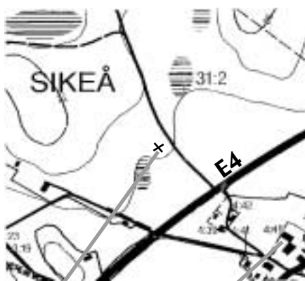
Placering av mast.

om en beskedlig "mast". Eftersom själva masten inte strålar är den inte en miljöfarlig verksamhet. Det blir det först när sändaren sitter på plats. Men sändaren kräver inget tillstånd från Miljö och -byggnadsnämnden och kan sedan bara sättas upp (detta trots domen).