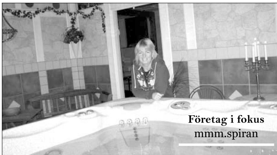
Företag i fokus mmm.spiran

– Jo, det står för m öten, m at och m ys, för-