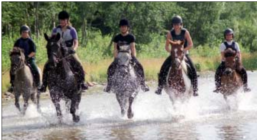
Ett gäng tjejer från Sandgårdans ridklubb tog tillfället i akt och red i vattnet nere vid Östersia när sensommaren var varm och behaglig.