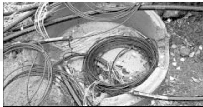
Uppkopling via modem är snart ett minne bort...