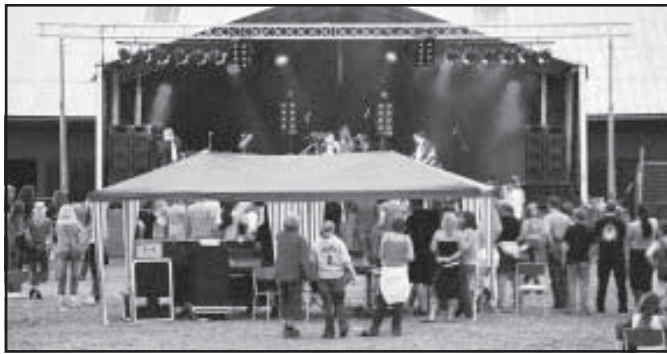
Sikafestivalen 2004 fick både ris och ros.

Det är ett rent nöje att se och höra bra musik framföras i augustinattens ljumma sken, och inne på området kunde man ta del av många olika genrer. Att ordna en musikfestival som inte lever om tycker vi är ganska omöjligt. Att festivalen då äger