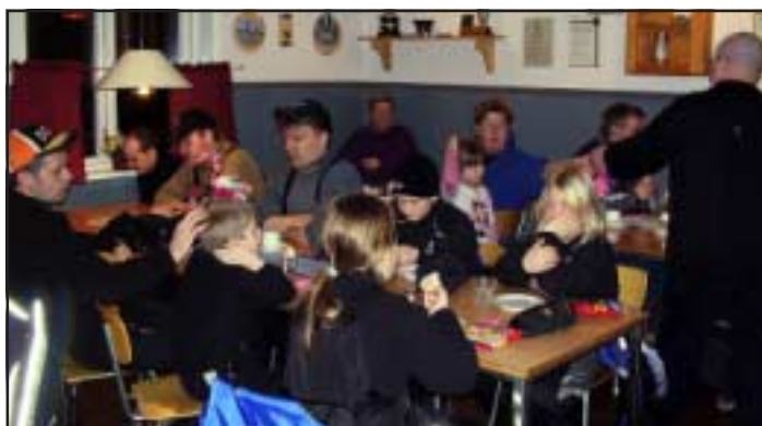
Gofika i Sika lockade mycket folk till Träffpunkten.