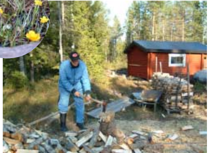
Är det pessimism eller realism att skaffa mycken ved till kommande vinter.