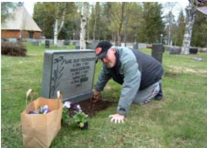
Bråda tider att plantera i täppan och vid graven.