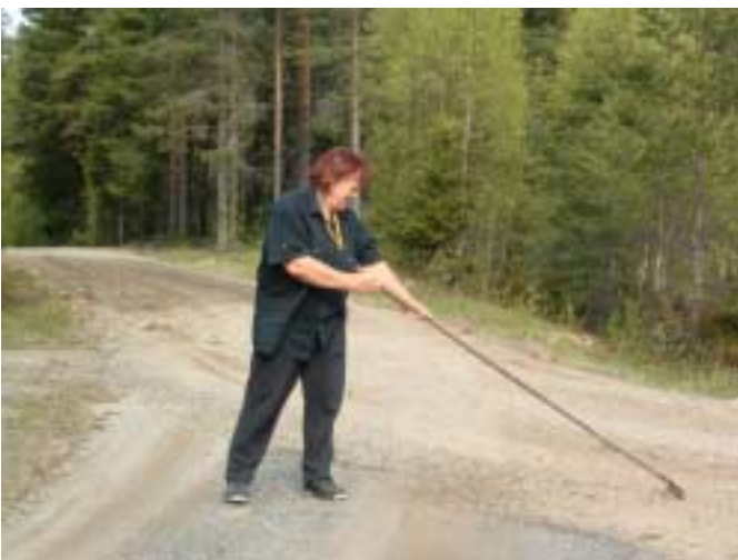
Allmänt arbete för allmän trivsel.