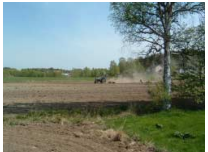
Genom rök och damm besås vår odlade mark av vår ende bonde, fritidsbönderna och utbyssarna.