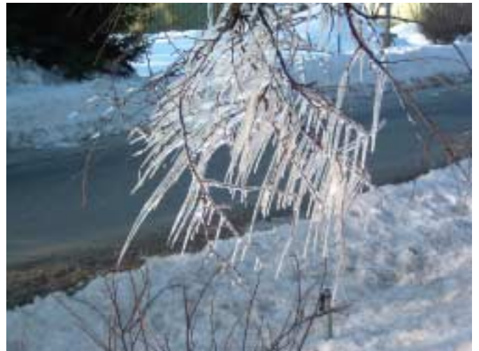
Tyngdlagen upphävs av varmare vindar.