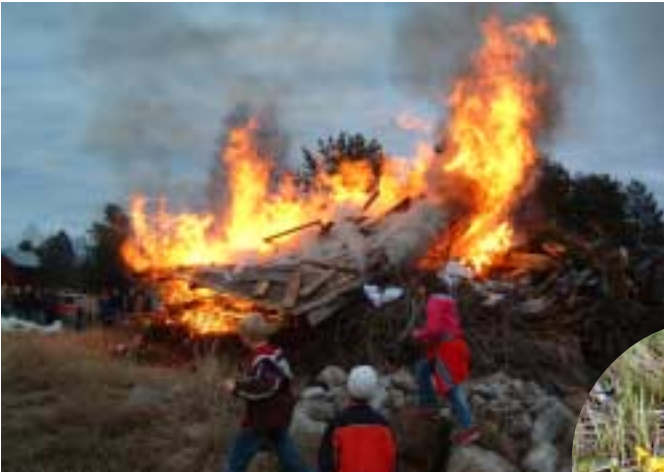
Våren ger växtkraft och spring i bena.